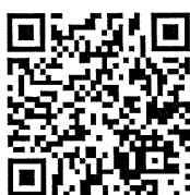
QR Code สำหรับ Global UGRAD 2016 Application